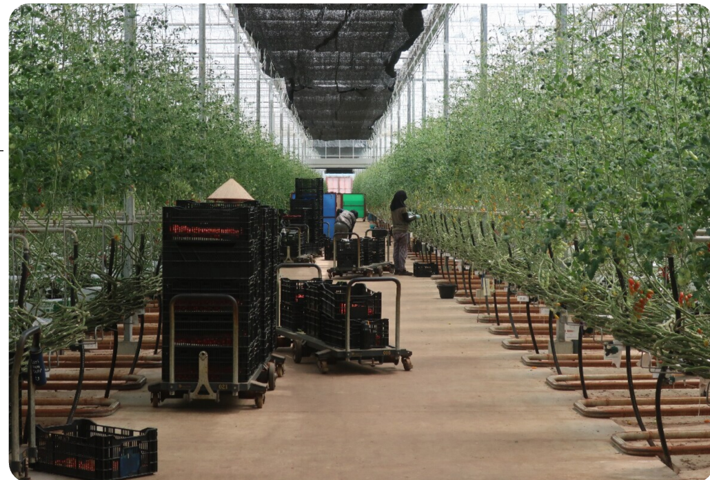
環境制御型栽培ハウス。でかいハウスで、外国人も雇用され、収穫ロボットも作動していました。